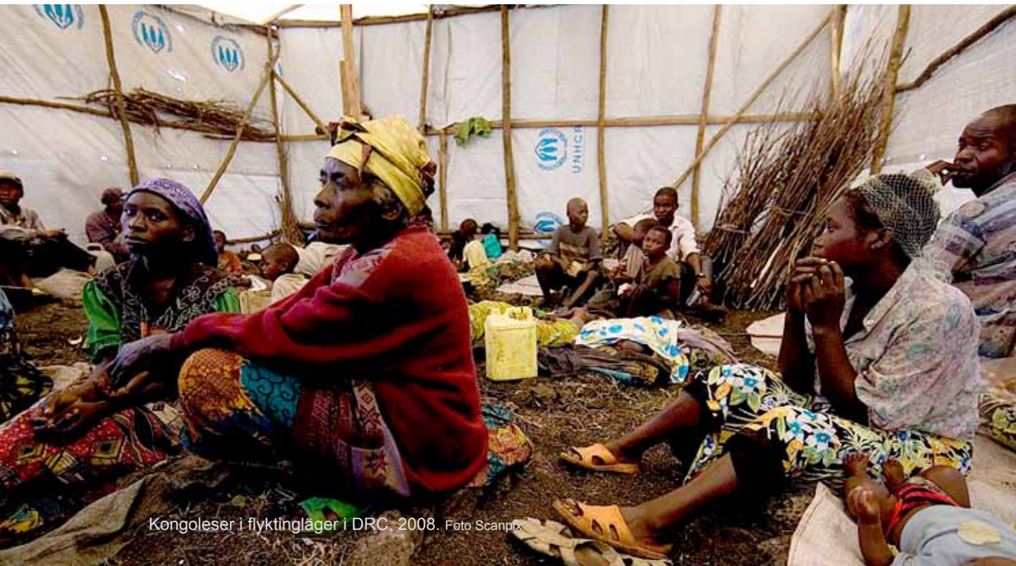
Kongoleser i flyktingläger i DRC, 2008.

Efter folkmordet i Rwanda 1994 rörde sig stora flyktingströmmar av rwandier till östra Kongo och resultatet blev att konflikten i Rwanda fick fäste även i Kongo. FN har konstaterat att konflikten i Kongo har förvärrats av de oroliga situationerna i grann-